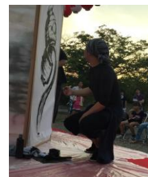
墨絵ライブイメージ

戦国武将を中心に動物・自然を題材に書を書くように命を描き、墨に濃淡をつけない独自のスタイルを考案し、白と黒のコントラストの美しさを追求。日本各地でのイベントパフォーマンスや個展を開催。