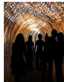
輝きの道イメージ

イルミネーションデザイン監修:照明デザイナー/NAIKIDESIGN INC.内木宏志