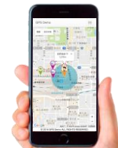
京都・梅小路エリアNAVI (※画像はイメージです。)