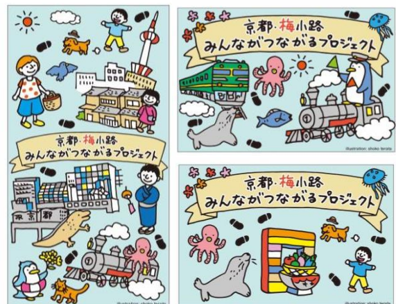
バナー・フラッグデザイン