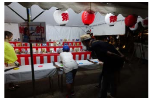
ミニ縁日イメージ

開催日：2018年8月4日(土) 開催時間：17時00分～20時30分 点灯イベント(点灯時間) 19時15分頃～ 開催場所：芝生広場 野外ステージ付近 対象及び定員：親子(小学生までのお子さま)先着100組 ※1組1セット 申込方法：①参加人数(大人・子どもの各人数) ②代表者の氏名 ③電話番号 ④メールアドレスを記載し、7月25日(水)までに 下記のメールアドレス宛に申込 申込先：umekouji.tourou@gmail.com