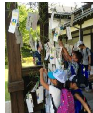
笹に願いごとをイメージ

設置日時：2018年8月4日(土)、5日(日) 設置箇所：京都水族館、京都鉄道博物館、中央広場(※)、市電カフェ、市電ショップ、梅小路パークカフェ、緑の館 ※中央広場のみ11日(土・祝)、12日(日)も設置