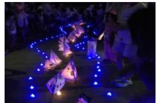
オリジナル行灯点灯イメージ